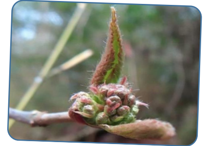
ミヤマガマズミ(深山英蒨) 花芽・葉芽の展開