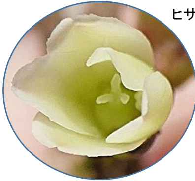
ヒサカキの雌花、雄花(右)