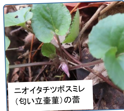
ニオイタチツボスミレ (匂い立壺堇)の蕾