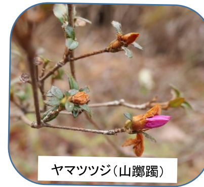
ヤマツツジ(山躑躅)