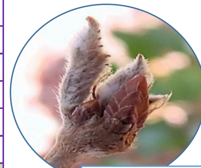
コナラ 芽鱗を脱す