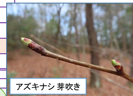
アズキナシ 芽吹き