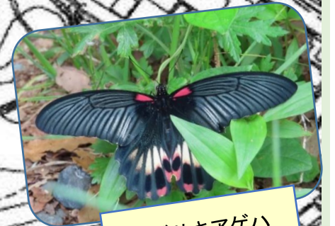
ナガサキアゲハ (長崎揚羽)♀ 羽化後