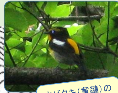
キビタキ(黄鶺鴒)の 高く澄んだ囀りを 聴き分けよう