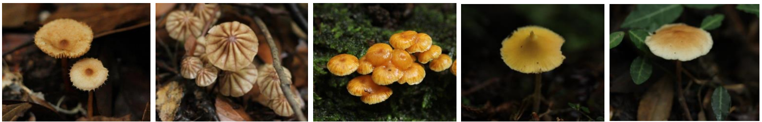
アシボソチチタケ□ スジオチバタケ□ ヒメカバイロタケ□ キイボカサタケ×有毒 モリノカレバタケ○