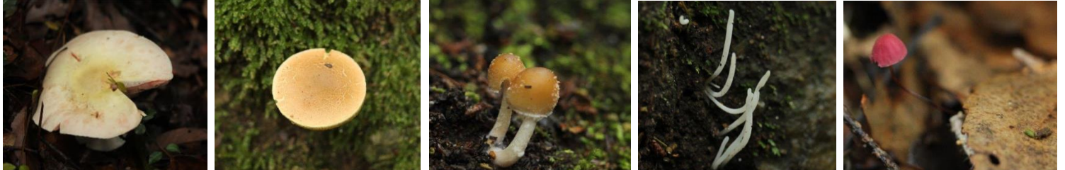
ハラタケ○食用 コウジタケ○ イタチタケ○ シロソウメンタケ○ ハナオチバタケ□不明

山頂ではシャシャンボの花が満開、こんな遅い時期に咲くとは！ イソノキも目立たない小さな花を咲かせており、何か珍しい物を見て得した気分。1月に見かけた「この実何だ?」「ひょっとしてホツツジ?」を、確かめに進軍。山頂から小町の滝の方へ数分下った急斜面にその株は群生しており、枝の稜や穂の形から、本物のホツツジに間違いないと皆さん納得！天然記念物級の発見で大喜び。ヤブコウジの花を見ると新分類でサクラソウ科に変わったのも少し納得。梅雨はきのこの季節。次々現れるきのこを馬場博士が適当に？面白く解説してくれるので大いに盛り上がりました(笑)