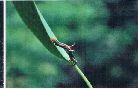
シカ角の加モンキバダシヤク