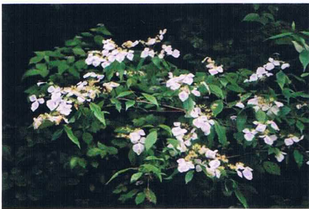
白がまぶしいガクウツギ

今回は室兼林道を入口から歩くことにしました。入口にある空きスペースに車を止めて出発。ウツギ、エゴノキ、モチツツジ、ガクウツギ、タニウツギ、コックパネウツギ、コアジサイと花の咲く樹木が林道沿いに次々と現れました。岩井谷との分岐で昼食にしました。岩の切通しを過ぎたところで13時となり、コバンノキを観察して引き換えしました。腰までヒルが上がってきて、びっくりされた方もいましたが、思ったよりもヒルが少なくてよかったです。次は7月にまたおじゃましますので、万全のヒル対策でご参加ください。