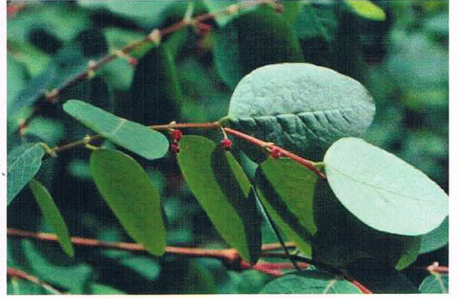
溪谷の樹コバンノキ