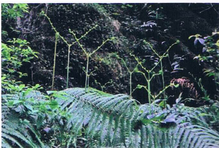
ウラジオアンテナで受信良好