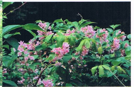
パステルなタニウツギ