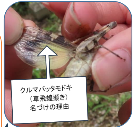
クルマバッタモドキ (車飛蝗擬き) 名づけの理由