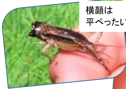
横顔は 平ぺったい