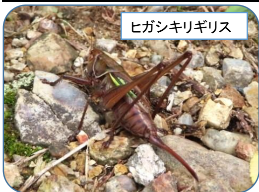
ヒガシキリギリス

※ケラはコオロギの一種であるが触角は短く、産卵管は目立たず、翅を立てずに鳴く例外種。