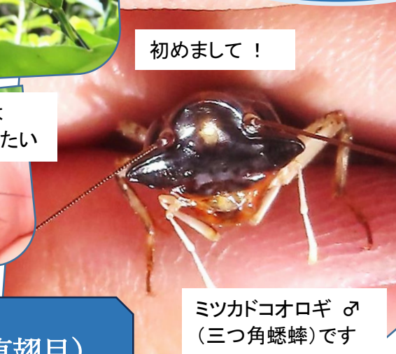
ミツカドコオロギ ♂ (三つ角蟋蟀)です