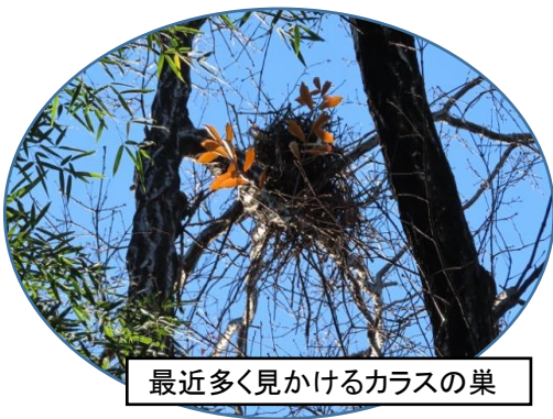
最近多く見かけるカラスの巣