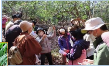
ヒサカキの花を調べよう・3月