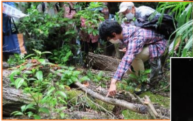
入門！菌類キノコの世界・6月