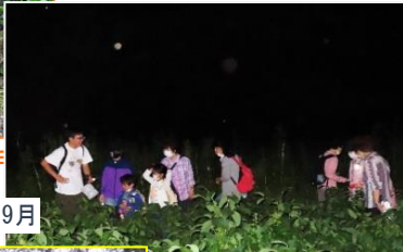
お月さまと秋の虫・9月