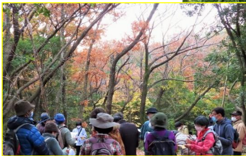
2021年締めて黄葉コナラ・12月