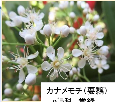
カナメモチ(要鵜) バラ科 常緑 レッドロビンに近種