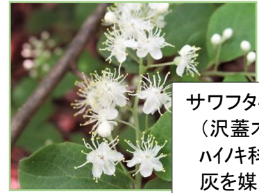
サワフタギ (沢蓋木) ハイナキ科 灰を媒染に