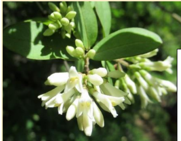
イボタノキ(水蠟樹) モクセイ科 ネズミモチも同科 イボタロウは有用物質 栽培種の生き残り?