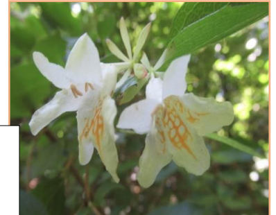
ツクバネウツギ (衝羽根空木) スイカズラ科 花も対生