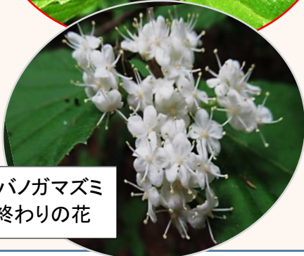
コバノガマズミ 終わりの花