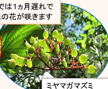
ミヤマガマズミ 果実ふくらむ