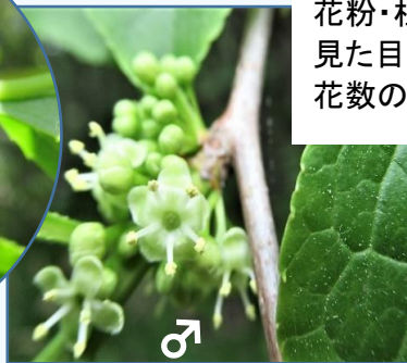
アオハダ(青肌) モチノキ科