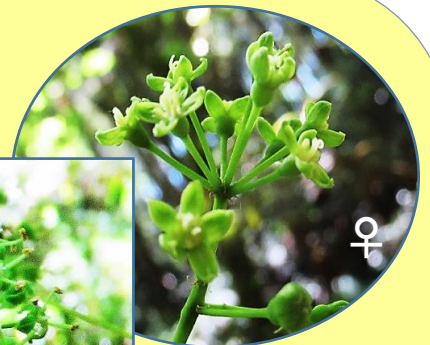
タカノツメ(鷹の爪) ウコギ科