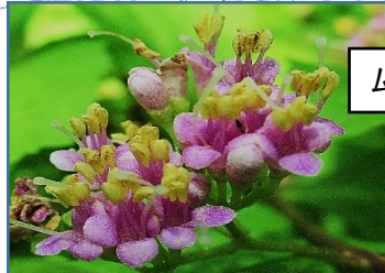
ムラサキシキブ(紫式部)

次回 7月14日(日) 9:30～ ～江戸町人や万葉人になって ハギを愛でよう 真夏の森に遊ぼう～