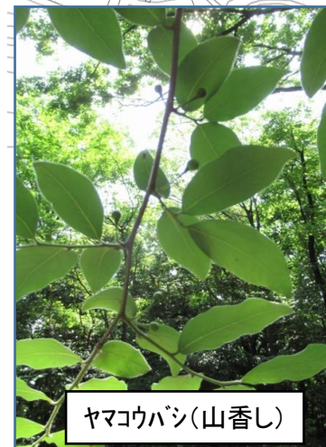
ヤマコバシ(山香し)