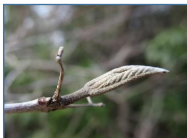
ムラサキシキブ(紫式部)