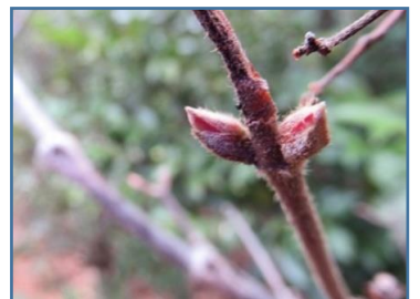
コバノガマズミ(小葉の英蒨)