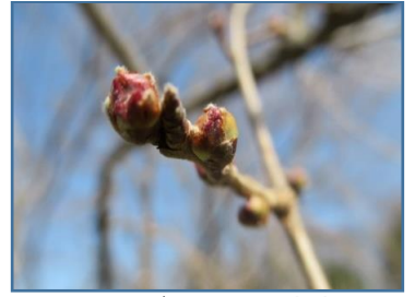
エドヒガン(江戸彼岸)