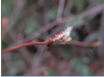
ザイフリボク(采振木)