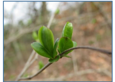
イボタノキ(水蠟樹)