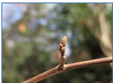
エゴノキ(えごの木)