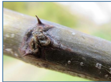
ハリエンジュ(針槐)