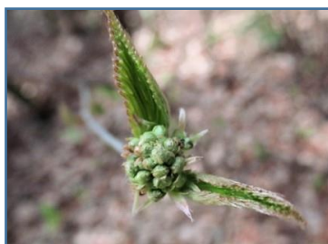
ミヤマガマズミ(深山英蒨)