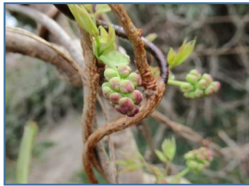
ミツバアケビ(三つ葉木通)