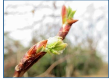
アズキナシ(小豆梨)