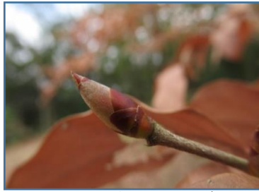
ヤマコウバシ(山香ばし)