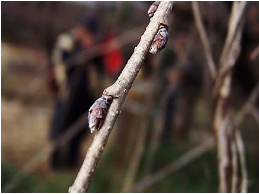
エドヒガン(江戸彼岸)