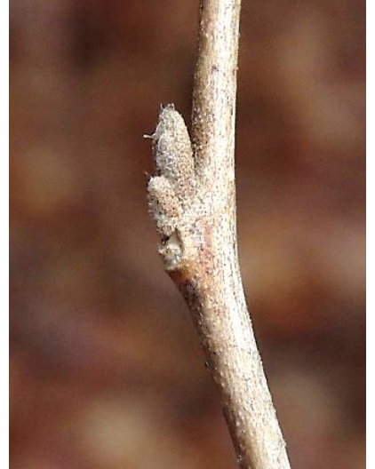
エゴノキ(えごの木)