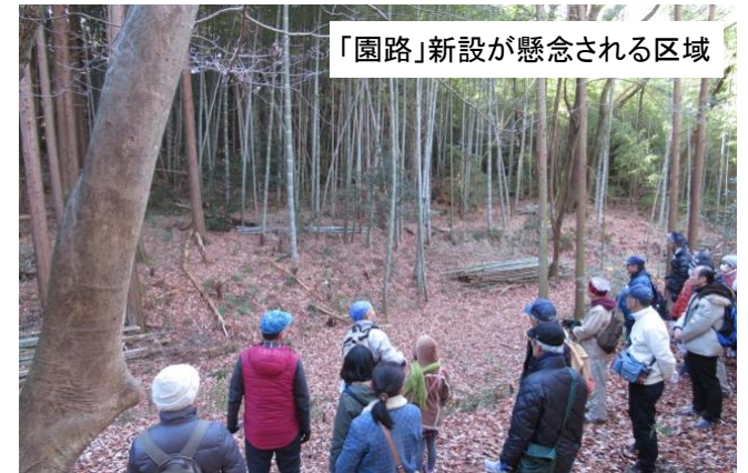
「園路」新設が懸念される区域