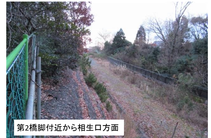
第2橋脚付近から相生口方面