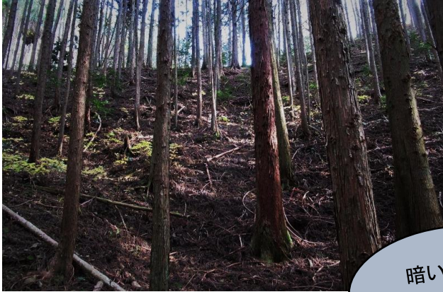
放置されたままの人工林