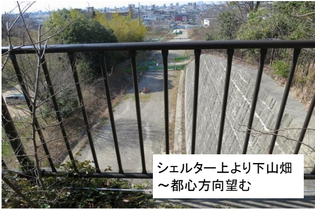
シェルター上より下山畑 ～都心方向望む