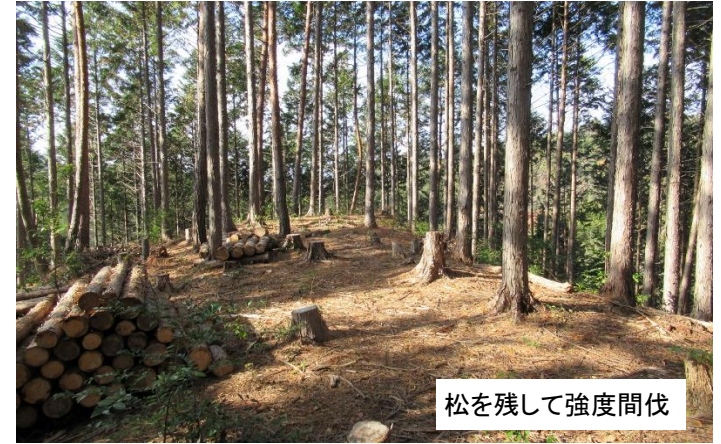
間伐済みの人工林