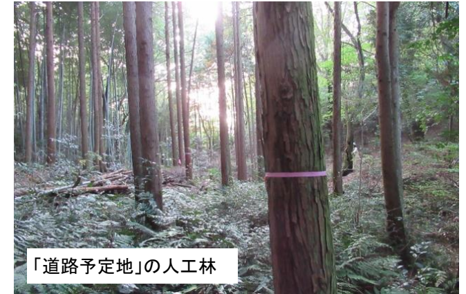
「道路予定地」の人工林