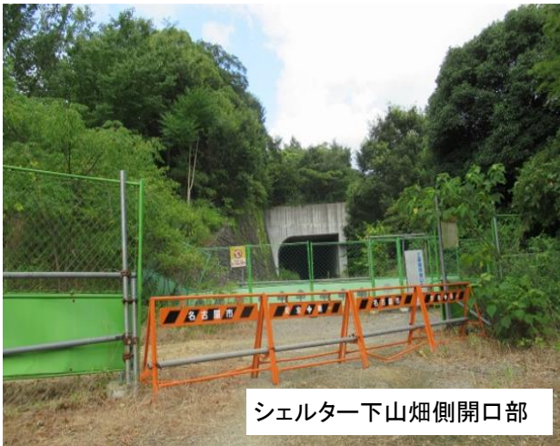
シェルター下山畑側開口部