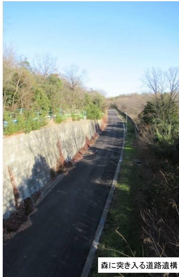
森に突き入る道路遺構