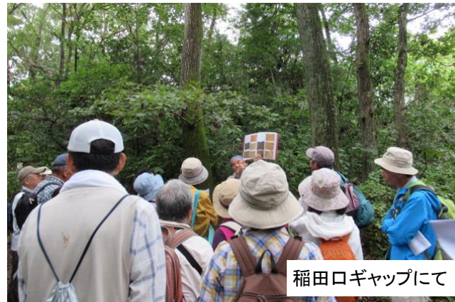
稲田口ギャップにて