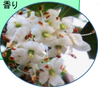
ヒラギ(栂)の花 香り