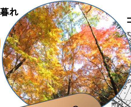
コゲラ(小啄木鳥)のドラミング