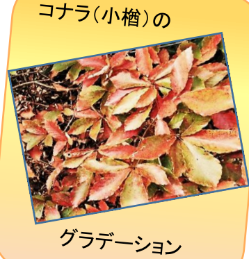
コナラ(小櫓)のグラデーション