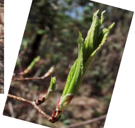
アズキナシ(小豆梨)