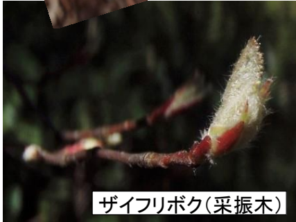
ザイフリボク(采振木)