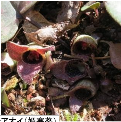
ヒメカンアオイ(姫寒葵)