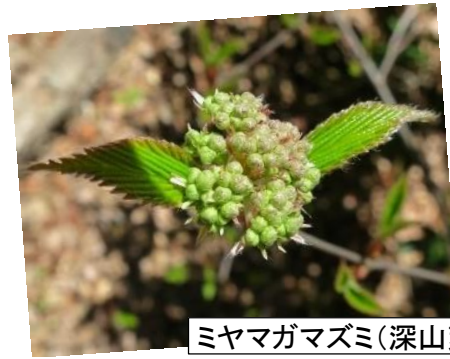
ミヤマガマズミ(深山莢迷)