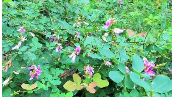
ヤマハギ(山萩) マメ科