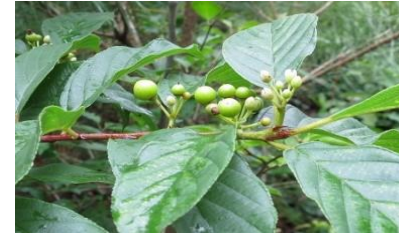
イソノキ(磯の木) クロモドギ科