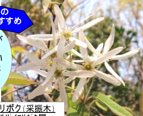
ザイフリボク (采振木)

バラ科ザイフリボク属 別名: シデザクラ (四手桜) アメリカザイフリボク Juneberry