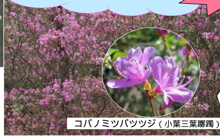
コバノミツバツツジ (小葉三葉躑躅)

どれもやせた尾根筋に 多く生育しています 雄しべの数 葉のようす 毛の有無 腺毛の粘り 花の色などで区別します