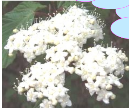
ミヤマガマズミ (深山莢迷)