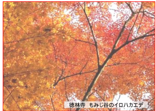
徳林寺 もみじ谷のイロハカエデ