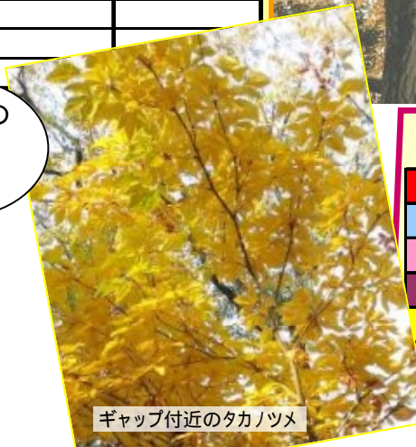
ギャップ付近のタカノツメ