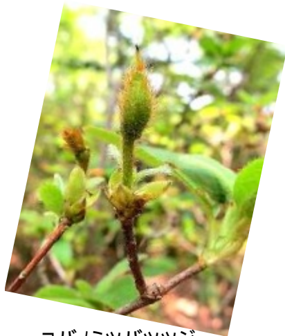
コバノミツバツツジ