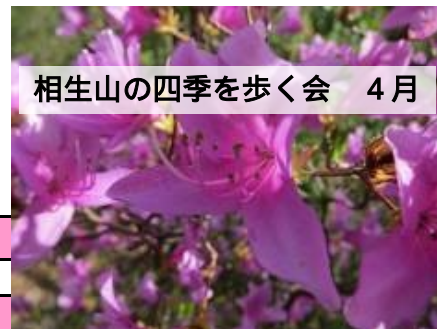
相生山の四季を歩く会 4月