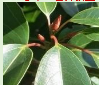
クスノキ(樟)の ダニ部屋??