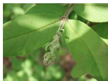
イボタノキ(水蠟樹)