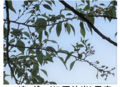
エドヒガン(江戸彼岸) 果実