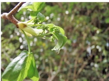
タカノヅメ(鷹の爪)