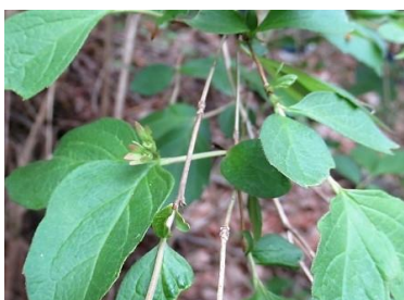
ツクバネウツギ(衝羽根空木)