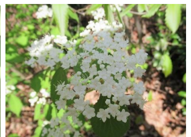
コバノガズミ(小葉莢蒾)