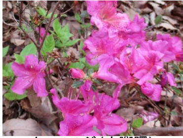
ヤマツツジ(山躑躅)