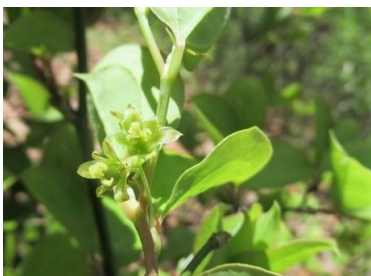
サルトリイバラ(猿捕茨)