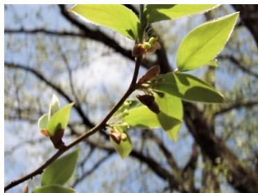
ヤマコウバシ(山香ばし)