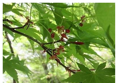
イロハカエデ(いろは楓)