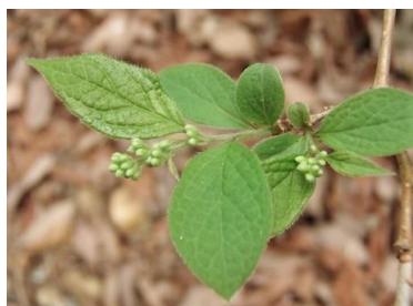
サワフタギ(沢蓋木)