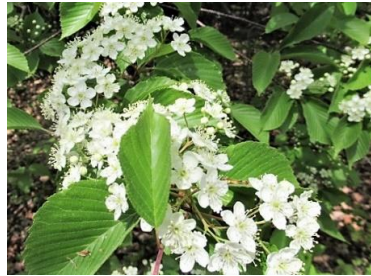
アズキナシ(小豆梨)